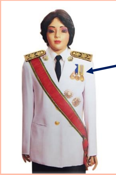
เครื่องแบบเต็มยศ

ประดับดารา ดวงตรา และสวมสายสะพายเช่นเดิม เหรียญราชอิสริยาภรณ์ เช่น เหรียญจักรพรรดิมาลา เหรียญที่พระราชทานเป็นที่ระลึก ในโอกาสต่าง ๆ ให้ประดับโดยใช้แพรแถบ แบบบุรุษ