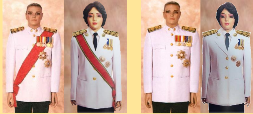
ป.ม. - ป.ช. สะพายบ่าขวา, ม.ว.ม. - ม.ป.ช. สะพายบ่าซ้าย

ชนิดมีสายสะพาย เต็มยศ ครึ่งยศ (ไม่สวมสายสะพาย)