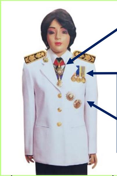
เครื่องแบบเต็มยศและครึ่งยศ (ประดับเครื่องราชอิสริยาภรณ์เหมือนกัน)

เช่น ท.ช., ท.ม. (เดิมประดับหน้าบ่าเสื้อมีดารา)