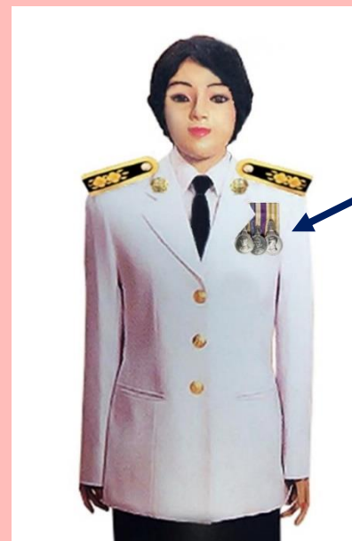
เครื่องแบบเต็มยศและครึ่งยศ

ประดับแพรแถบ เหรียญที่พระราชทานเป็นที่ระลึก ในโอกาสต่าง ๆ แบบบุรุษ ที่อกเสื้อเบื้องซ้าย