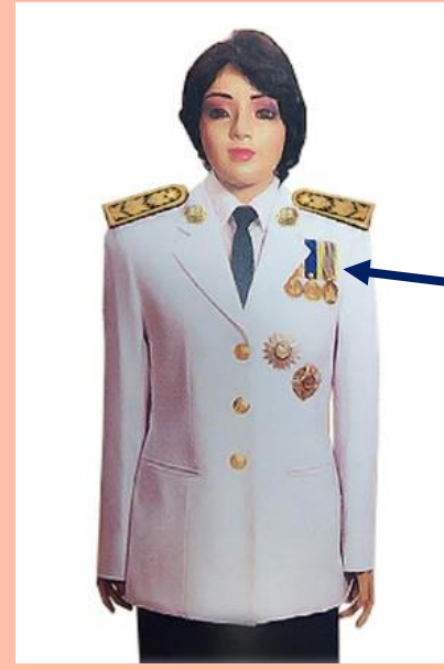
เครื่องแบบครึ่งยศ

ประดับดารา ดวงตรา และสวมสายสะพายเช่นเดิม เหรียญราชอิสริยาภรณ์ เช่น เหรียญจักรพรรดิมาลา เหรียญที่พระราชทานเป็นที่ระลึก ในโอกาสต่าง ๆ ให้ประดับโดยใช้แพรแถบ แบบบุรุษ