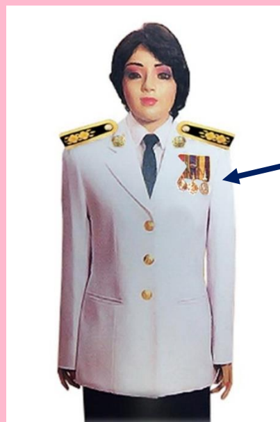
เครื่องแบบเต็มยศและครึ่งยศ (ประดับเครื่องราชอิสริยาภรณ์เหมือนกัน)

เช่น จ.ช., จ.ม., บ.ช., บ.ม., ร.ท.ช., ร.ท.ม., ร.ง.ช., ร.ง.ม.